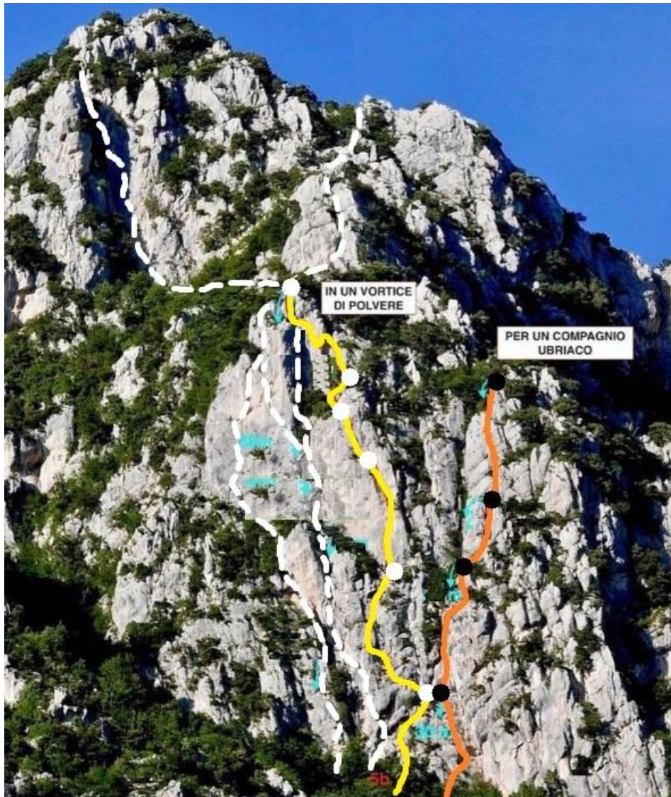
Tracciati delle vie, GIALLO e ROSSO; (in tratteggio BIANCO) alcuni progetti